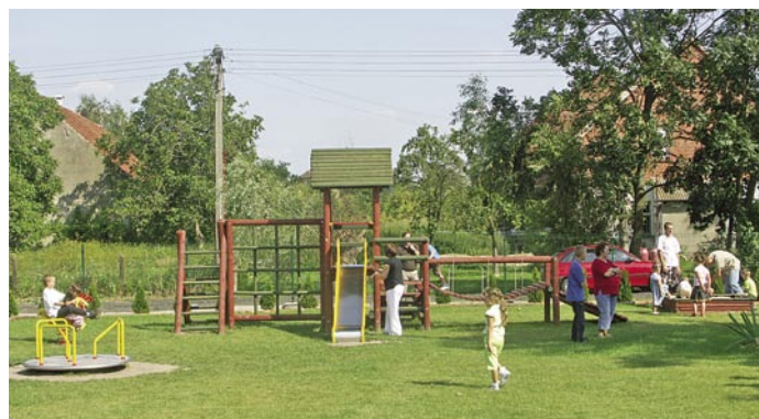
Nowe place zabaw powstają sukcesywnie na obszarze całej gminy. Na przedostatniej stronie gazety znajduje się galeria zdjęć z dotychczas wykonanymi placami zabaw na terenie gminnych miejscowości.

Jeżeli chodzi o remonty dróg, to w Blizocinie i Jażwinach została podpisana umowa z wykonawcą na ich remont. Podobna sytuacja ma miejsce, jeżeli chodzi o miejscowości Ujeździec Mały, Kobylice, Księginice oraz Boleszcin. Na remont dróg w tych miejscowościach podpisana została jedna umowa, a łączne koszty finansowe wynoszą 879 840,00 zł. Droga w Jażwinach remontowana była na odcinku ponad 1000 m, natomiast w Blizocinie na odcinku kilkuset metrów. W pozostałych wymienionych miejscowościach położona zostanie nowa nakładka na poszczególnych odcinkach dróg.