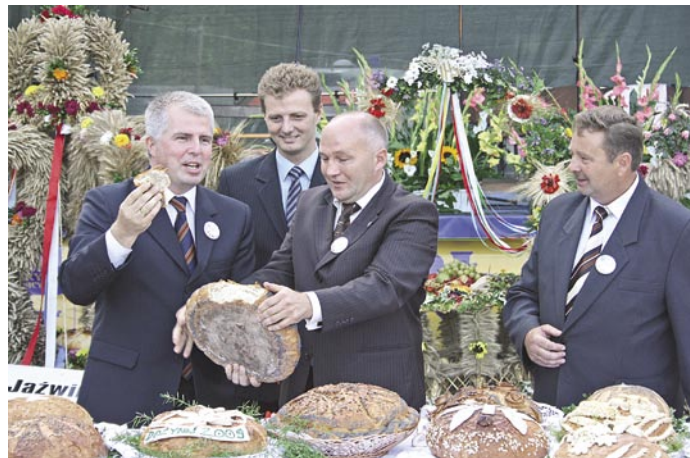
Wspólne łamanie chleba