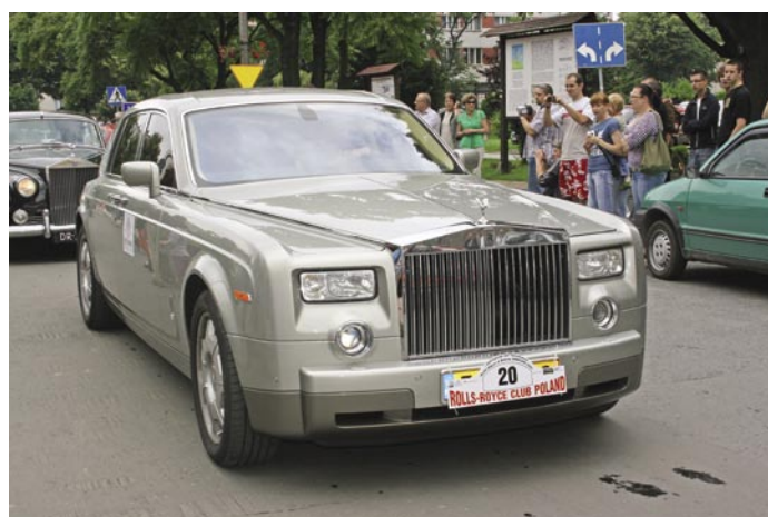
Wśród aut były również produkowane obecnie