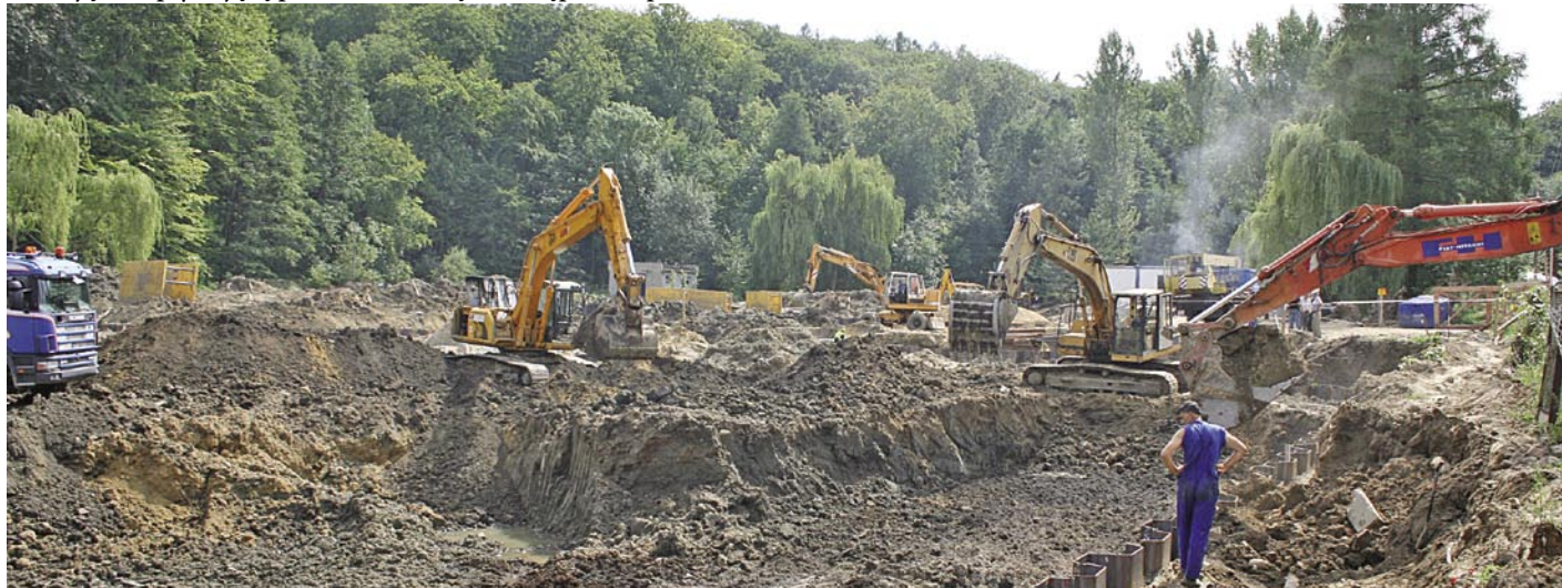
Prace przy budowie basenu