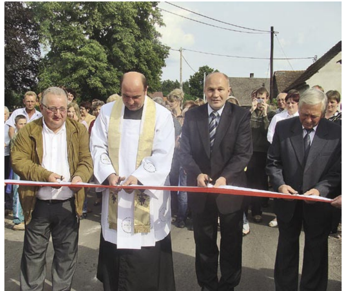
Otwarcie nowej drogi w Kuźniczysku

Nowa droga służy również jako skrót do kościoła dla mieszkańców Masłowca i Blizocina, a także dla dzieci idących do szkoły. Droga kosztowała 800 000,00 zł, a plac zabaw - 35 000,00 zł.