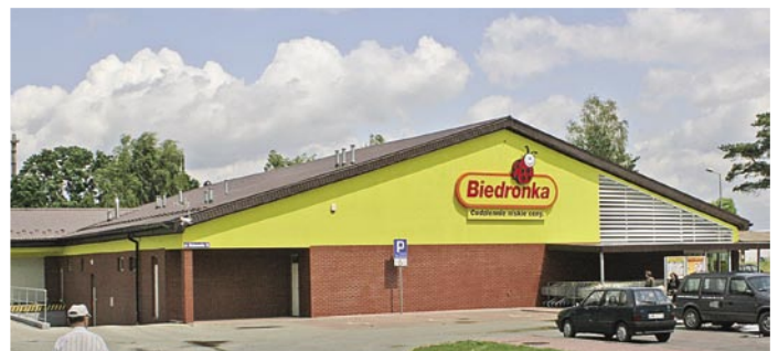
Podobna „Biedronka” powstanie wkrótce również w Trzebnicy