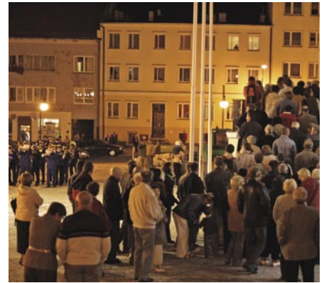
Mieszkańcy licznie przybyli na nocne zwiedzanie miasta. Wydarzenie ubogacone było występem Trzebnickiej Orkiestry Dętej