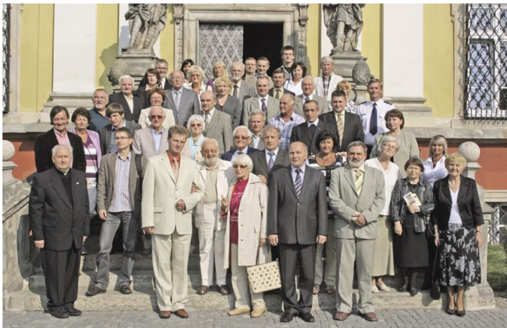
Wspólne zdjęcie uczestników konferencji przed wejściem do klasztoru

ratów tematycznych o pradziejach Trzebnicy, jej rozwoju przestrzennym i architektonicznym, zagadnieniach dotyczących założenia klasztoru czy życia politycznego, gospodarczego i społecznego miasta, układów architektonicznych, stosunków narodowościowych oraz wielu innych kwestii. Wszystkie referaty zostały przedstawione w bardzo ciekawy i przystępny