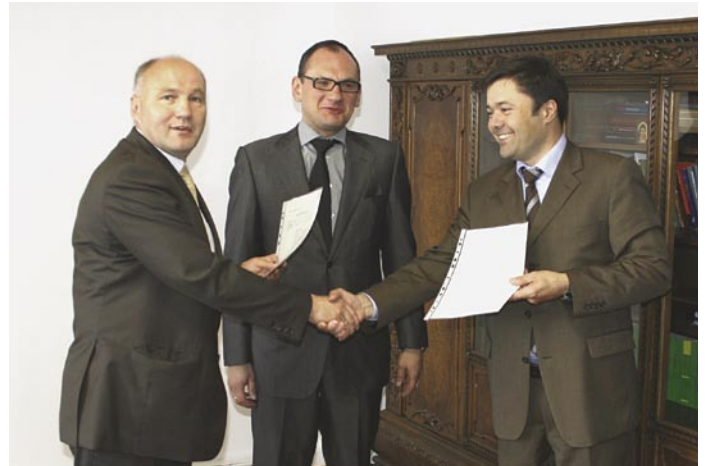
Przekazanie aktu notarialnego w obecności notariusza

Investor budujący „Biedronkę” uzyskał już pozwolenie na budowę. Natomiast właściciel sieci marketów „Intermarche” złożył wniosek o pozwolenie na budowę marketu, który zlokalizowany będzie na terenie dawnego placu targowego. Obecnie wniosek ten jest w trakcie rozpatrywania i wkrótce powinna zapaść również decyzja zezwalająca na rozpoczęcie budowy.