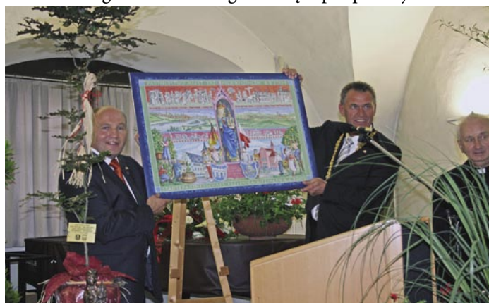
Prezent dla Trzebnicy - obraz lokalnego artysty przedstawiający różne aspekty pogłębiającego się partnerstwa między miastami

Warto nadmienić, że kontakty te systematycznie rozszerzają się na coraz to szersze kręgi społeczne obu miast. Ku uciesze władz samorządowych współpracę ze swoim niemieckim odpowiednikiem podjął Zespół Szkół w Ujeźdźcu Wielkim. Dzięki temu w maju bieżącego roku młodzież ucząca się w Ujeźdźcu Wielkim gościła w Kitzingen. Dzięki podpisanej umowie o