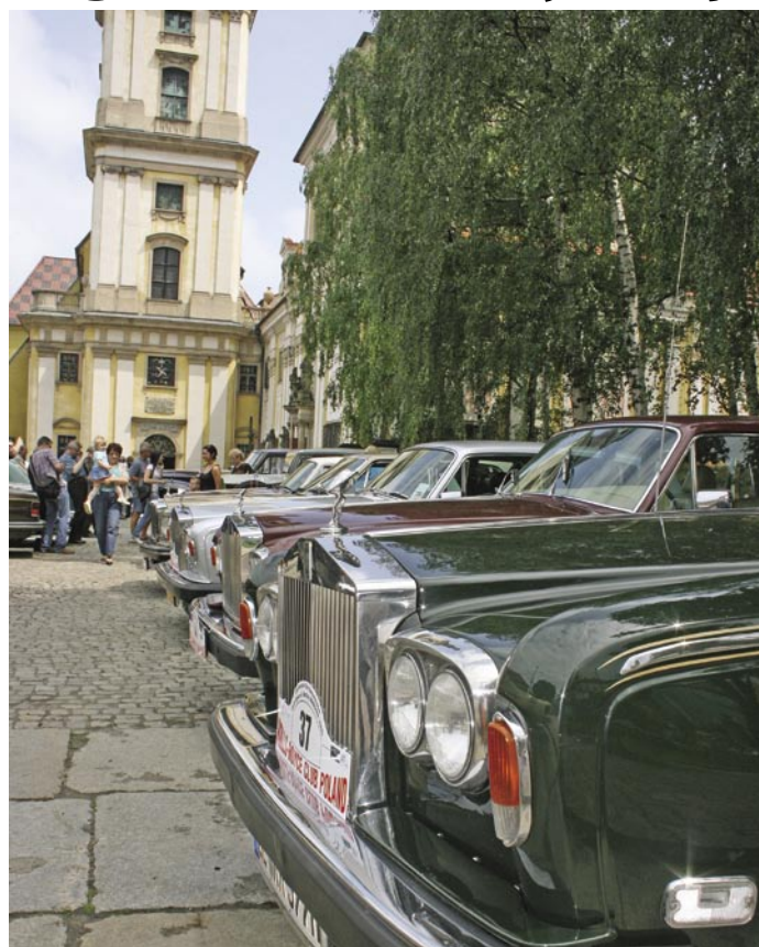
Duża ilość Rolls-Royce'ów wywarła na oglądających spore wrażenie

„Świetna wystawa!”. „Nigdy nie widziałem czegoś podobnego” – można było słyszeć wśród oglądających. Pokaz przyciągnął mieszkańców w każdym wieku – od najmłodszych aż po dziad-