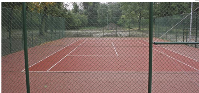
Tenis ziemny to kolejna dyscyplina sportowa, którą można będzie uprawiać na kompleksie sportowym „Orlik” w Trzebnicy

Kompleks sportowy „Orlik”, cieszący się dużym zainteresowaniem mieszkańców, zostanie wzbogacony dodatkowo o kort tenisowy. Wykonawcą robót jest firma Budmel. Koszty inwestycji to 215 000,00 zł.