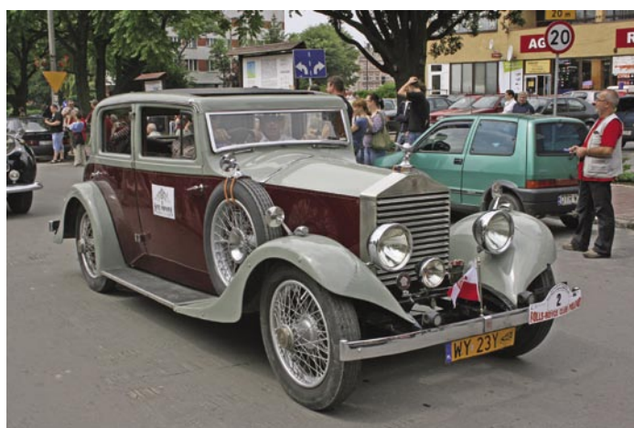
Najstarsze auto zlotu - rok produkcji - 1927

ków z wnuczkami, matki z dziećmi, młodzież, kobiety i mężczyźni.