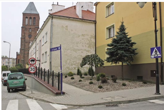
Regularne remonty w różnych częściach miasta sprawiają, że coraz więcej miejsc zyskuje nowy wygląd, pozytywnie wpływając na wizerunek Trzebnicy.

„W końcu uporządkowane zostało to, co powinno być zrobione już dawno temu. Miło teraz tędy przechodzić” - mówi jeden z mieszkańców miasta zapytany o nowy wygląd okolic ulicy Lipowej. Droga ta prowadzi do jednego z ważniejszych zabytków Trzebnicy - kościoła pw. św. Piotra i Pawła oraz na odnowiony rynek. Ogólny koszt inwestycji wraz z nasadzeniami wyniósł 116 000,00 zł.