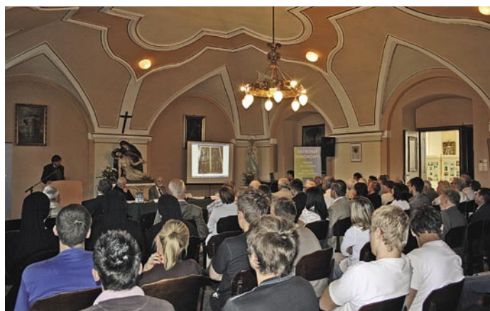
Prelekcja o sztuce i architekturze Trzebnicy

W trakcie trwania poszczególnych bloków wysłuchano refe-