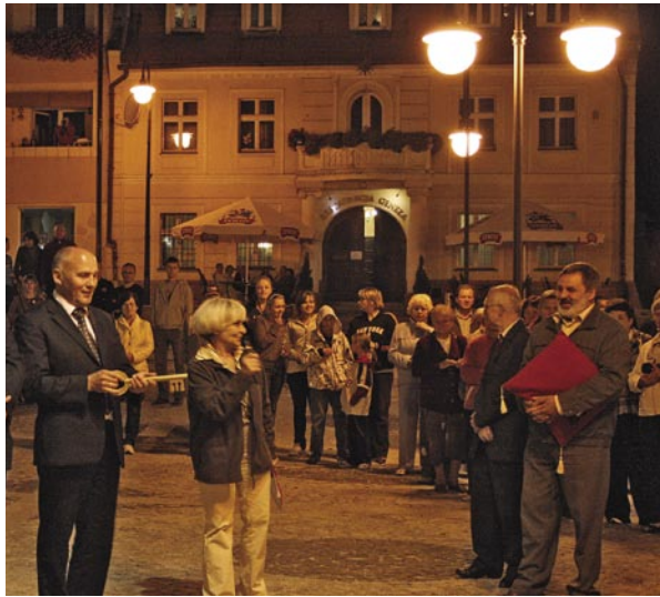
Przekazanie symbolicznego klucza do bram Trzebnicy