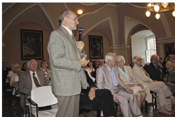
Po wygłoszonych referatach prelegenci odpowiadali na liczne pytania związane z ich dziedziną wiedzy

sposób, poparte niejednokrotnie prezentacjami. Konferencja została skierowana do uczniów szkół gminnych oraz powiatowych, nauczycieli historii, osób zainteresowanych tematyką historyczną na przestrzeni lat jak również wszystkich mieszkańców gminy i miasta. Ogromne zainteresowanie konferencją młodzieży w bloku przedpołudniowym spowodowało, iż na sali brakowało miejsca. W podsumowaniu spotkania około godziny 17.00 rozgorzała dyskusja, w której poruszono kwestie dotyczące zakresu merytorycznego nowej monografii. Zatem przed całym zespołem redakcyjnym stało ważne, jakże odpowiedzialne zadanie zebrania i opracowania materiału w sposób nowatorski oraz przystępny dla potencjalnego odbiorcy.