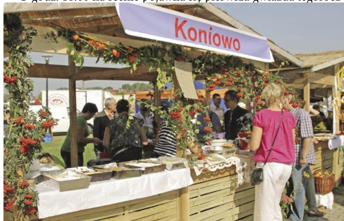
Stoiska wyglądały wyjątkowo okazale

O godz. 18.00 na scenie pojawiła się pierwsza gwiazda tegorocz-