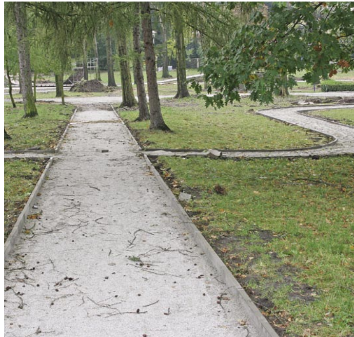
Obecnie w parku wytyczane są nowe ścieżki