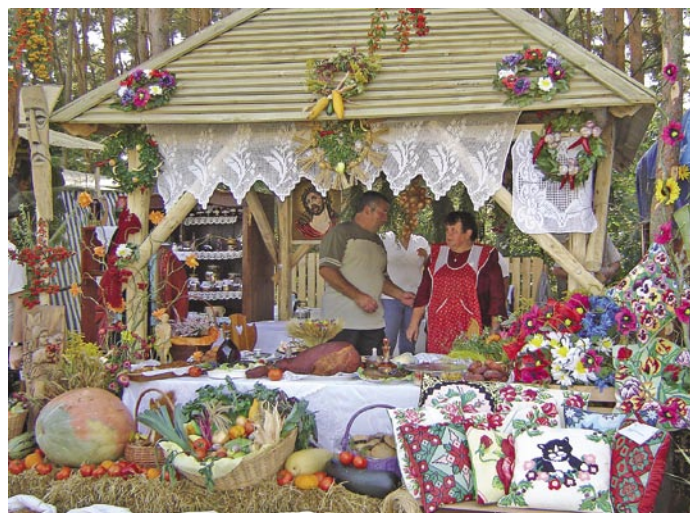
Kramik z Ligoty zdobył w tym roku nagrodę główną