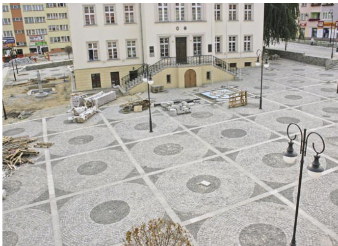
Prace wykończeniowe na płycie Rynku

Trwające od lutego prace remontowe na trzebnickim Rynku w szybkim tempie zmierzają do końca. Położona jest już prawie całkowicie kostka, w ostatnim czasie staną również pręgier.