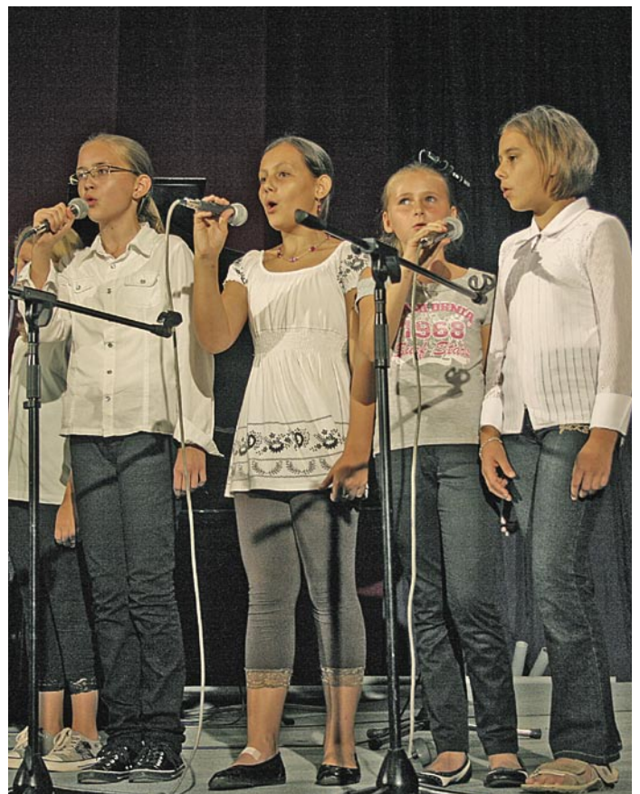
Uroczystości ubogacone były artystycznymi występami dzieci z gminnych szkół

W związku z upamiętnieniem 70 rocznicy Wybuchu II Wojny Światowej w Trzebnicy odbyły się dodatkowo spotkania z kombatantami w poszczególnych szkołach na rozpoczęcie roku szkolnego 2009/2010, lekcje historii, wystawy oraz konkursy. 15 września w Trzebnickim Ośrodku Kultury odbył się konkurs recytatorski pt. „Aby pamięć nie zgasła...”. Konkurs zorganizowany został dla uczniów szkół podstawowych i gimnazjalnych z terenu naszej gminy. Uczniowie w swoich recytacjach zaprezentowali