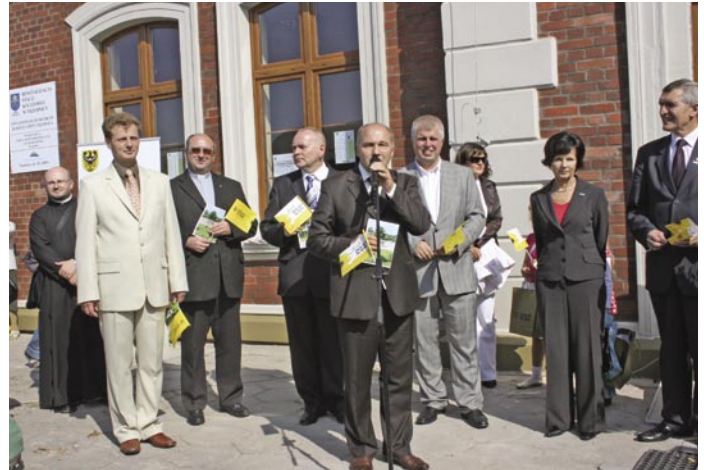
Oficjalne przemówienia przed wyremontowanym dworcem