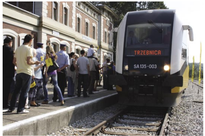
Mieszkańcy z entuzjazmem witają szynobus

LEGENDA: o - odjazd, p - przyjazd, N - kursuje tylko w niedziele