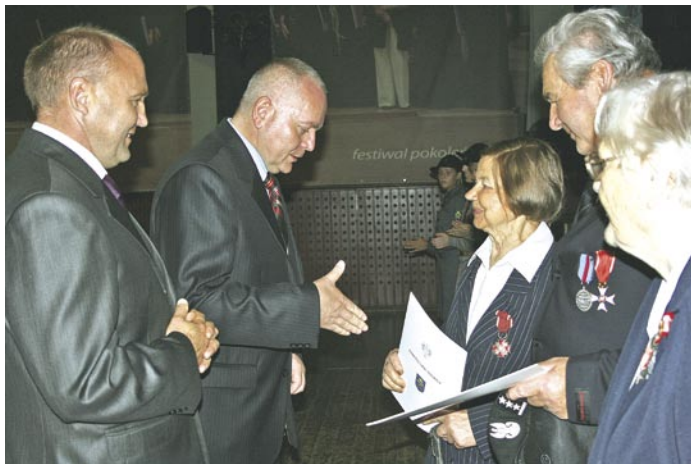
Dyplomy uznania wręczał Burmistrz wraz z Przewodniczącą Rady Miejskiej