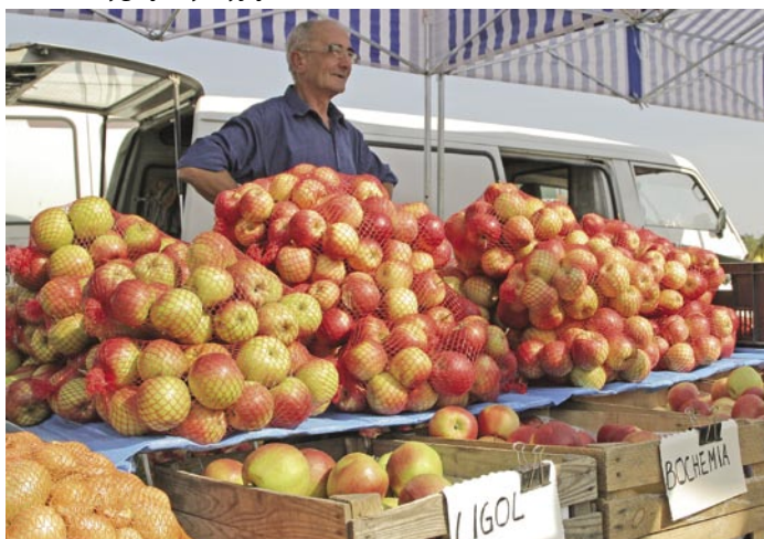
Jabłka to markowy produkt Trzebnickiego Święta Sadów

nego Święta Sadów-Iwona Węgrowska. Artystka podczas półtorejgodzinnego koncertu zaśpiewała swoje największe przeboje, m. in. „Cztery lata”. Po niej na scenie mogliśmy podziwiać nasze rodzime talenty, a więc artystki z projektu „Młodzi Śpiewni”. Dziewczyny przez godzinę dostarczały gromadzącym się coraz liczniej na Placu Pielgrzymkowym trzebniczantom emocji śpiewając utwory Agnieszki Osieckiej oraz nowe aranżacje znanych utworów ludowych.