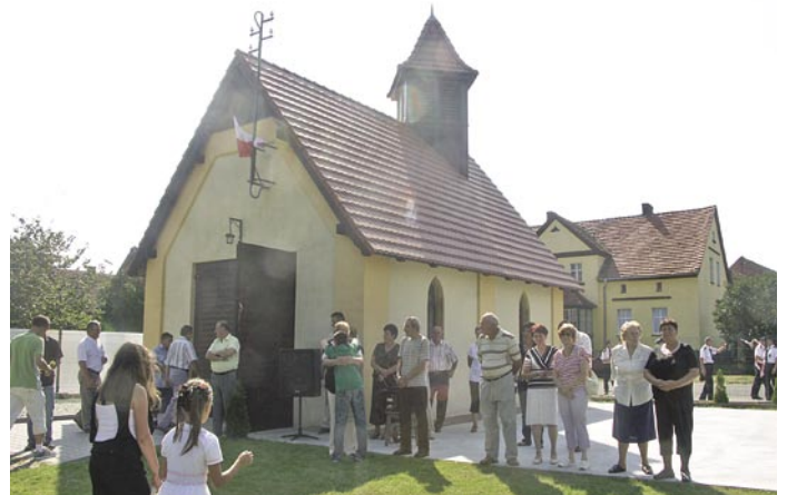
Nowa remiza w Brzykowie jest jedną z najładniejszych w całym regionie