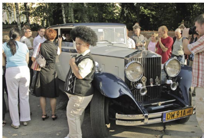
Podczas Święta Sadów dzieci nie tylko chętnie korzystały z darmowych przejazdów, lecz również fotografowały się na tle zabytkowych pojazdów

Bardzo dobra współpraca gminy z klubem zaowocowała również zorganizowaniem dla dzieci z Gminy Trzebnica bezpłatnego przejazdu ulicami miasta podczas tegorocznego „Święta Sadów”. Każde dziecko miało możliwość przejazdu Rolls Roycem. Atrakcja cieszyła się ogromnym zainteresowaniem, bowiem niecodziennie można zasiąść w tak luksusowym aucie i odbyć rundę honorową po mieście.