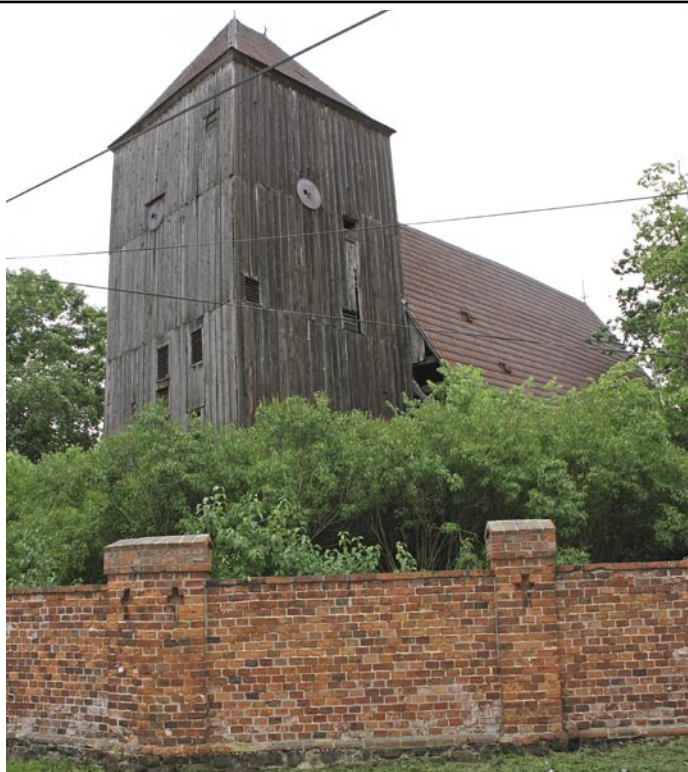
Kościół w Kuźniczysku

Kościół wykonany całkowicie w konstrukcji drewnianej, pierwotnie ewangelicki, którego pierwsze wzmianki pochodzą z 1709 roku, odrestaurowany został w XIX wieku, od lat jest nieużytkowany. Odbudowa tego pięknego obiektu rozpocznie się zaraz po przekazaniu jej na rzecz Fundacji i potrwa około kilku lat z uwagi na szeroki zakres prac, jaki należy wykonać na terenie i wokół budynku kościoła.