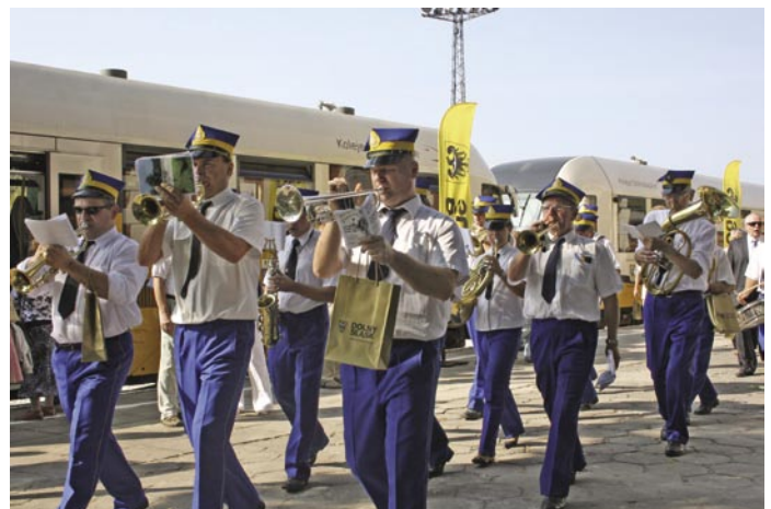
Trzebnicka Orkiestra Dęta uświetniła przyjazd szynobusa do Trzebnicy