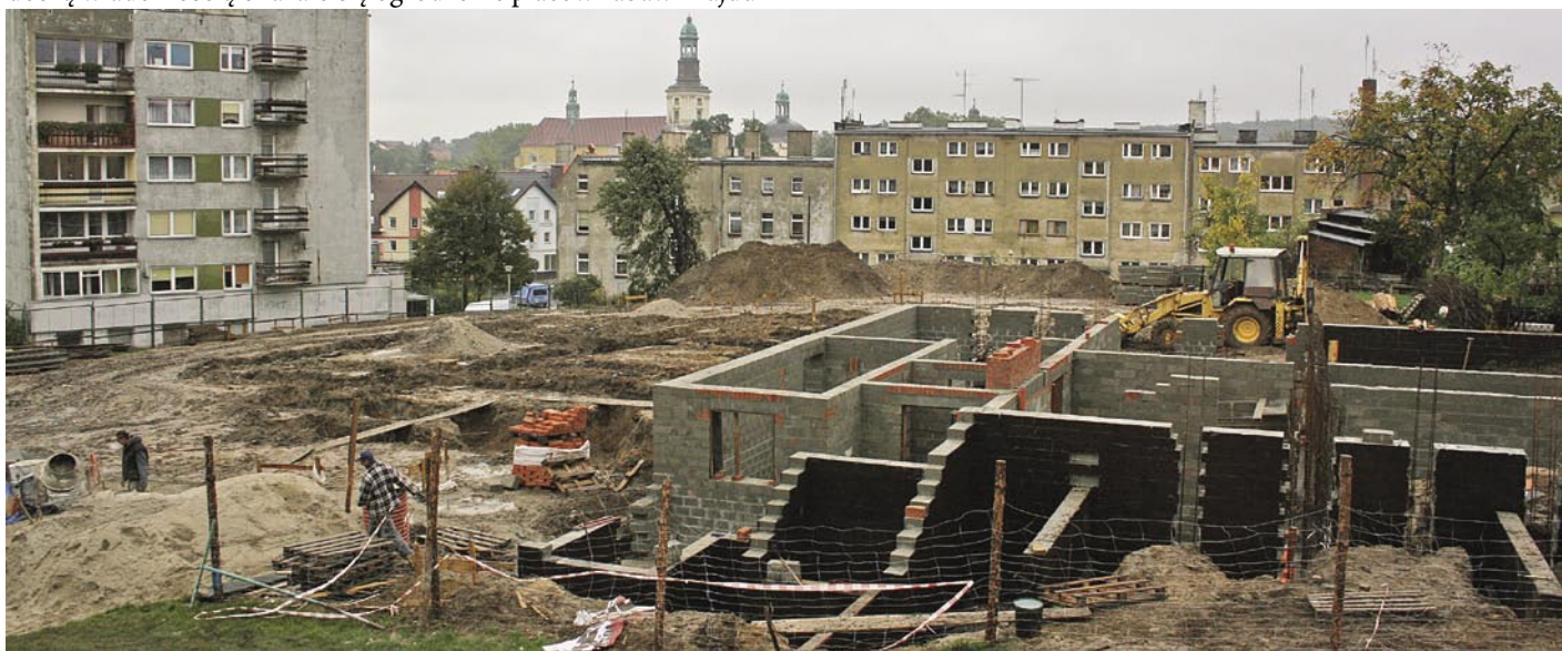
Nowe przedszkole pomieści 120 dzieci oraz grupę żłobkową. Obiekt ma być otwarty we wrześniu 2010. Koszty inwestycji wynoszą 2 660 000,00 zł. Poza placem zabaw przy nowym przedszkolu ma powstać również tor rowerkowy oraz saneczkowy, a także amfiteatr do organizowanych przez placówkę przedstawień.