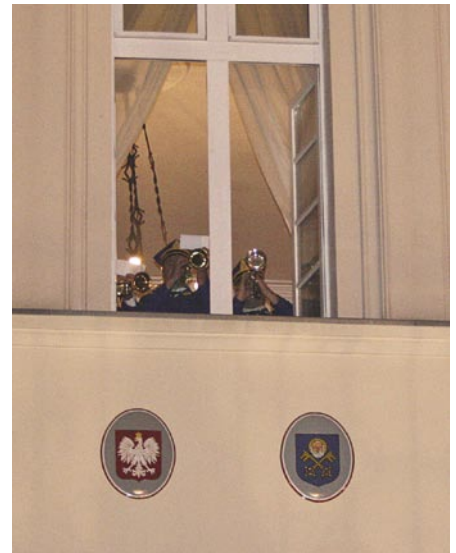
Z okien Ratusza odegrany został hejnał

zentującej Towarzystwo Miłośników Ziemi Trzebnickiej burmistrz otrzymał klucz do bram miasta, którym dokonał symbolicznego otwarcia miasta na nocne zwiedzanie zabytków.