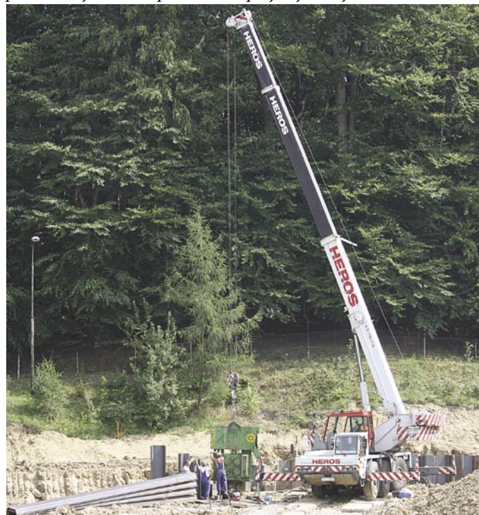
Montaż dodatkowych wzmocnień wokół basenu

jące ją do kanalizacji. Jak zapewnia burmistrz Marek Długozima: Z uwagi na niestabilność gruntu trzeba było przeprojektować budynek. W przypadku tak dużych inwestycji nie może być mowy o jakichkolwiek zaniedbaniach. Solidna konstrukcja będzie gwarancją trwałości budowy na lata. Przeprojektowanie basenu związane było z chwilowym wstrzymaniem prac, jednak inwestycja jest w kluczowym etapie, od którego zależą wszystkie kolejne działania. Liczy się przede wszystkim bezpieczeństwo przyszłych użytkowników.