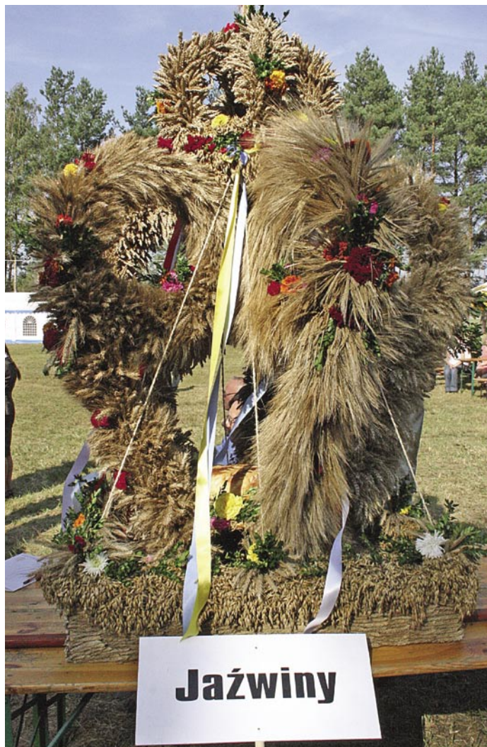
Tegoroczne zwycięskie wieńce. Więcej zdjęć z tegorocznych dożynek obejrzyć można na www.trzebnica.pl/galeria/dozynki_2009