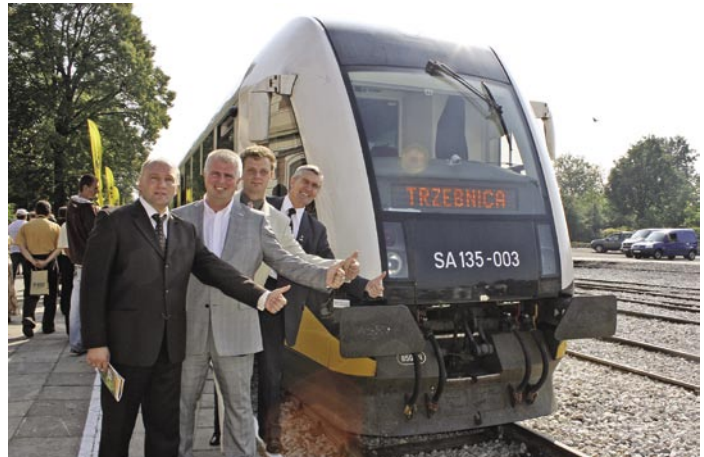
Wspólny cel został osiągnięty!