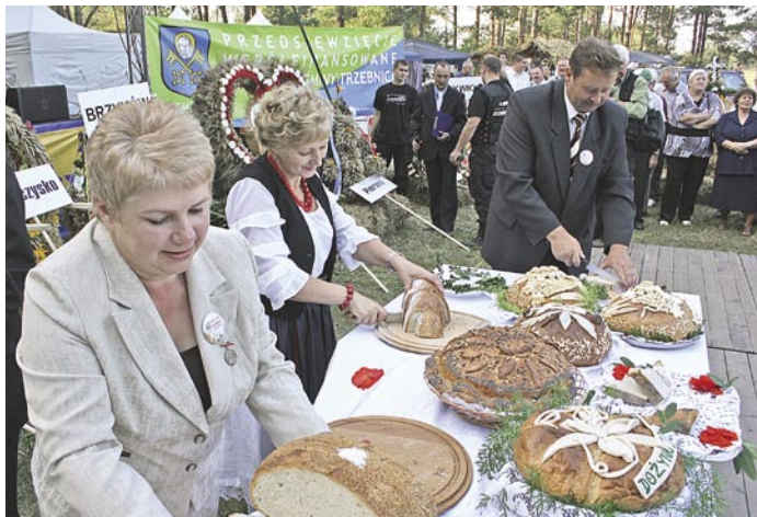
Starostowie dziellili każdy bochen chleba, by następnie podzielić się nim ze wszystkimi uczestnikami dożynek

nim udział wsie otrzymały wyróżnienia. W kategorii wieniec dożynkowy III miejsce otrzymały: Skarszyn, Ujeździec Wielki i Biedaczków Wielki, II miejsce przyznano dla Głuchowa Górnego i Taczowa Małego zaś I nagrodę otrzymały prace z Jażwin oraz Szczytkowic. W kategorii kramiku dożynkowego przyznano podobnie jak poprzednio wyróżnienia dla wszystkich konkursowiczów. I tak III miejsce za kramik zdobyli mieszkańcy z Głuchowa Górnego, Brzykowa, Szczytkowic, Ujeźdzca Małego oraz Kuźniczyska, II miejsce zajęły wspólnie Piersno i Jażwiny, a laury i I nagrodę otrzymał kramik z Ligoty. Wyraźnie widać, że miejscowości gminne wykazują się coraz większą aktywnością.