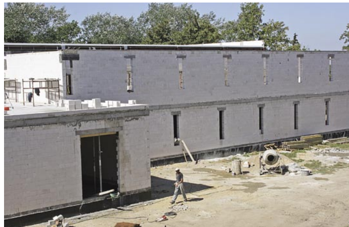
Hala sportowa przy Szkole Podstawowej nr 3 w Trzebnicy będzie zakończona jeszcze w tym roku szkolnym

Gmina przez cały czas wychodzi także naprzeciw potrzebom najmłodszych mieszkańców miejscowości wiejskich. W ramach dofinansowania z Programu Rozwoju Obszarów Wiejskich wykonano remonty świetlic w Koniowie i Skoroszowie. Z kolei świetlica w Domanowicach zostanie sfinansowana z konkursu Urzędu Marszałkowskiego Województwa Dolnośląskiego pt. „Odnowa Dolnośląskiej Wsi”. Ze środków gminy wykonano remonty w świetlicach w: Masłowie, Taczowie Małym, Rzepotowicach, Skarszynie, Komorówku, Biedaszkowie Małym i Raszowie. Ponadto w tym roku powstała dokumentacja projektowa ośmiu placów zabaw dla dzieci w miejscowościach: Będkowo, Blizocin, Jażwiny, Koniowo, Masłów, Skoroszów, Ujeździec Mały i Ujeździec Wielki. Wartość dokumentacji wyniosła 25 000,00 zł. W nowe huśtawki wyposażone zostały miejscowości: Brzyków, Ligota oraz Kobylice. Na zakup wyposażenia placów zabaw Gmina Trzebnica przeznaczyła w tym roku 85 300,00 zł. Dla mieszkańców Trzebnicy dobrą wiadomością okazało się ogrodzenie placów zabaw znajdu-