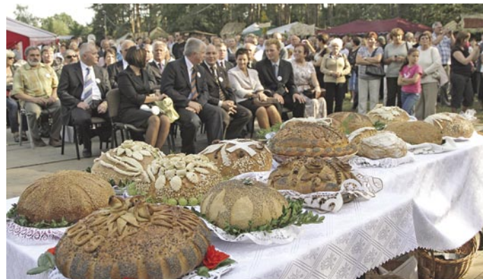
Chleby złożone w procesji z Darami