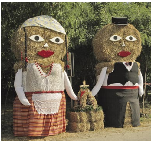
Wieś była pięknie przystrojona w każdym miejscu